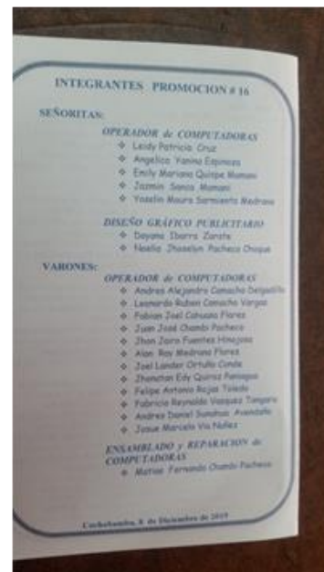
Lijst van geslaagden.