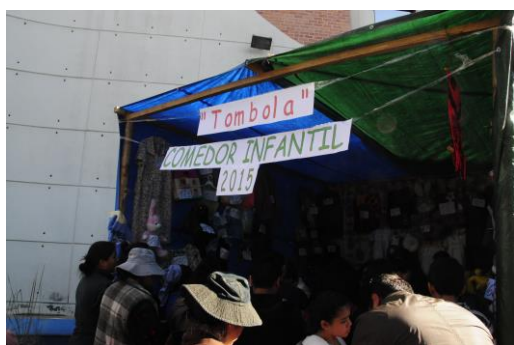
De kraam van Comedor Infantil